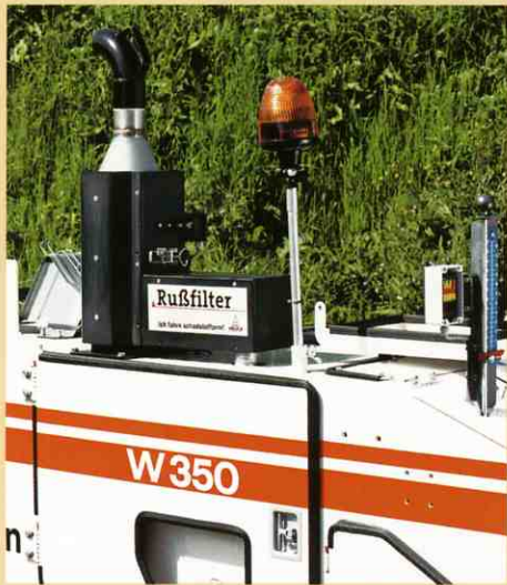
きれいな排気ガスのために:ばい煙フィルターが粒子の排出を90%抑えます。