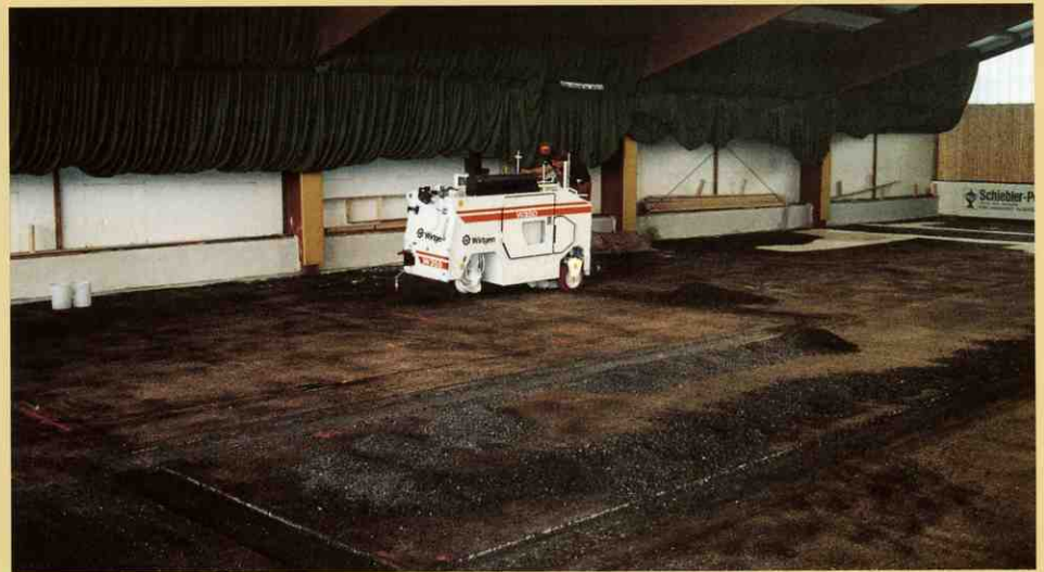
新しい材料で補填される場所のエッジは楔形に切削されます。

W350は非常に小さな機械で、かなり重量 を落とす事が出来るので、問題なくビルの中 に入ったり、作業をしたり出来ます。単位 面積あたりの効率がとても高いので、補修 に必要な時間を削減できます。