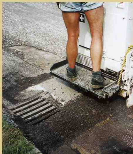
典型的な作業:雨水用のふたの周りをきれいに。