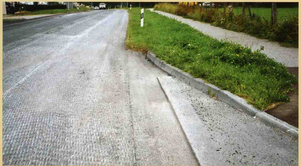
W350で大型機が切削した三角地帯や各切削レーンのつなぎ目の出っ張り等を切削します。

W350を使用すると残ってしまった作業にうるさいコンプレッサーやエアーハンマーを使う必要がありません。車道及び駐車場の入り口においても切削作業を直接にしかも正確に行う事が出来ます。このように全ての性能を適切に発揮することで作業時間が大幅に短縮でき、交通遮断を減らせます。