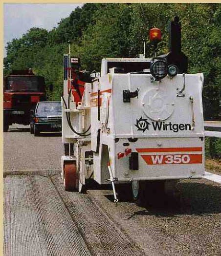
道路の上では“ヘビー級”で。