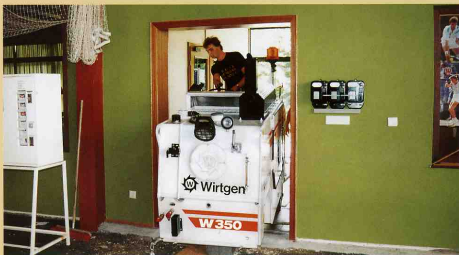
ドアを通り抜け、いよいよ屋内へ。

作業現場は交通混雑を避ける為の車線が確保されているため、柱や壁等の障害物により通路がふさがれたり角の多い場所での作業を強いられることは珍しくありません。機械のオペレーターは外の作業とは全く違う問題に直面する事があります。例えば作業現場が屋内で狭い入口の場合です。しかしW350はそのような問題は発生しません。右後輪が機械本体の内側に収納する事が出来るので、少なくとも幅1mのドアがあれば通過する事ができます。