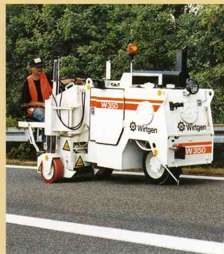
機械はすぐに次の作業場所に移動します。

切削したエッジの仕上がりの質のよさは切削工事の出来を評価するのに重要な尺度となります。 W350で切削したエッジは直角で、切削断面の状態もよく、切削屑も残っていません。 このことは新しく舗装する際、舗装合材を切削してエッジギリギリまで舗装できるので、効率の良い転圧が出来ることを意味します。 この方法で行えば補修した箇所の耐久寿命が長くなります。