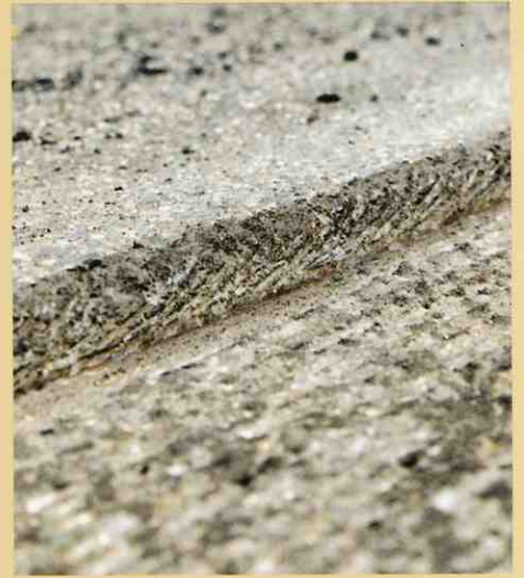
切削線には切削屑もなくきれいな切削断面が見られます。

W350の重心は低く、質量が良い具合に分散されており、切削機に取り付けるビットが最適に配置されているので、切削深さがかなりあっても、スムーズに動きます。また、騒音防止にも優れており、さらに使いやすいとなっております。このような作業で時折使われる付属の切削装置とちがって、W350の切削方法は現場の作業員に賞賛されています。