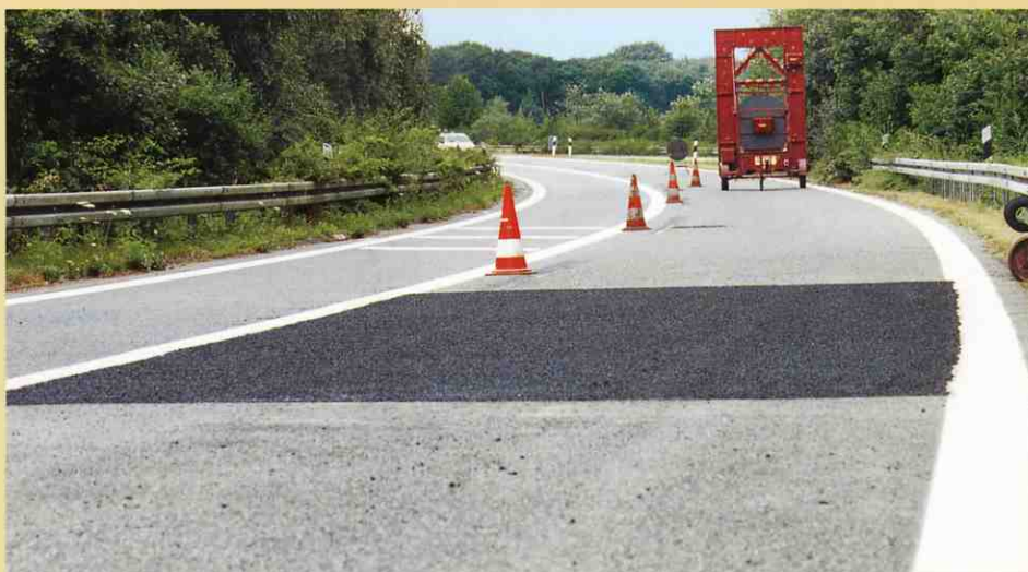
しっかりと補修された道路は数時間後通行が出来るようになります。