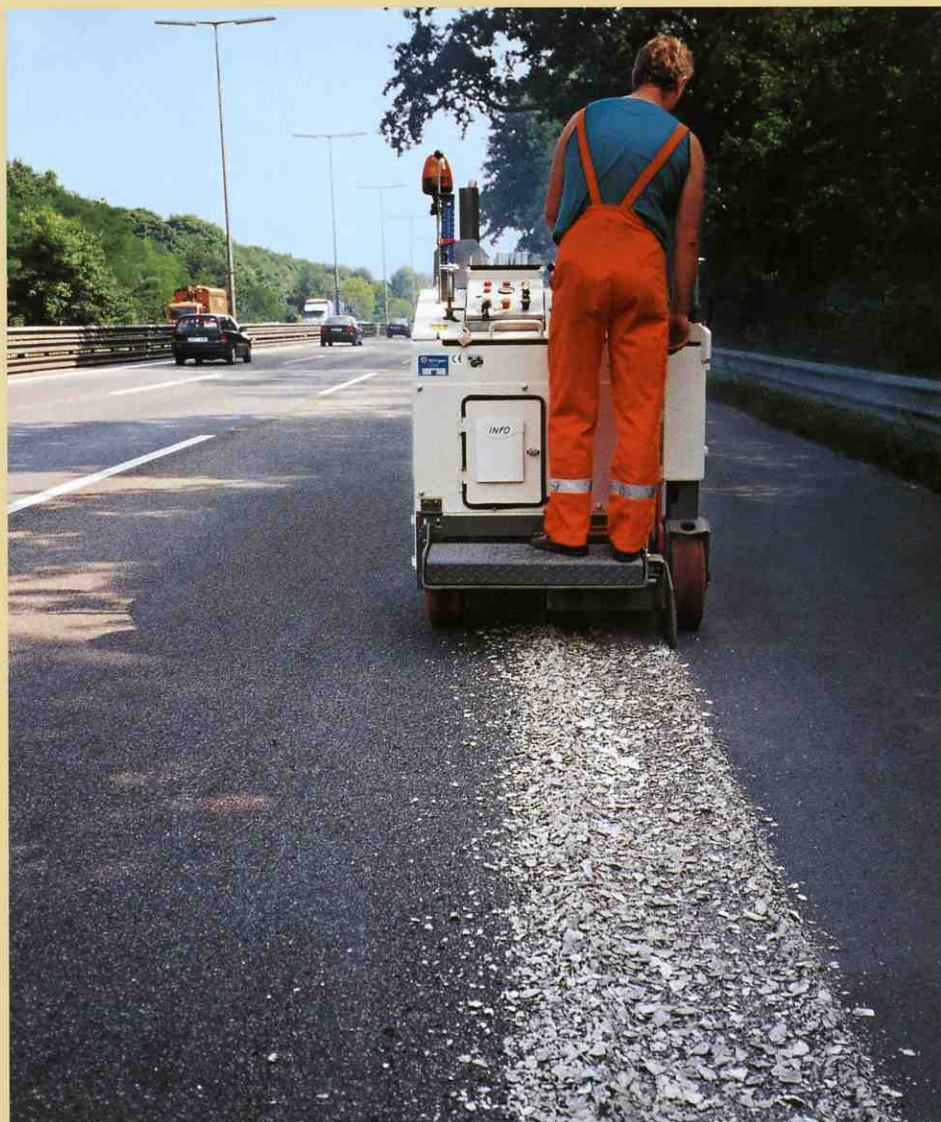
高速道路のレーンマークの除去は、W350のレーンマーク除去ドラムの典型的な適用例です。

そのため柔軟に対応できました、オペレーターがさまざまな特別な道路工事を請け負う事が出来るのです。