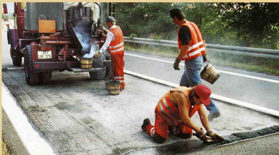
新しいマスティック表層材を清掃した切削部分に舗装します。

切削深さは正確に設定できるので、均一の厚さで新しい舗装が出来ます。 そのため新しい材料を節約できるだけでなく、新しい道路の転圧も均一に出来るのです。 切削した表面性状が良いため、新しい舗装材がよくかみ合います。 その結果、車が加速減速するときやカーブを曲がる際に発生する剪断応力が確実に下層に伝わります。 また道路表面全体の耐久力も確実に伸びます。