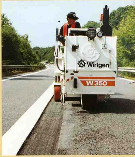
ドライバーは常に切削されたエッジをはっきり見る事が出来ます。

道路の耐久性を復旧するには道路の一部だけを修復すればよいことが多くあります。損傷はある部分の層だけに限られていることが多いので、損傷している部分だけを取り除くことが経済的にも重要になってきます。W350はこのような道路の一部を切削するのに最適な機械です。そしてフィニッシャやローラーと併せて補修グループでの作業機械としてその存在価値を立証しています。W350は小型のため、曲がりくねった様な現場でもきちんと切削できます。また、十分なパワーがあるため、異なる層でも10cmの深さまで1回の走行で切削する事が出来ます。