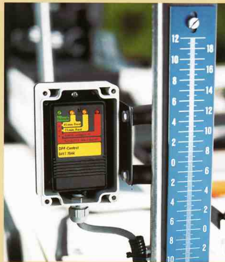
ばい煙フィルターの監視ディスプレイは運転位置からよく見えます。