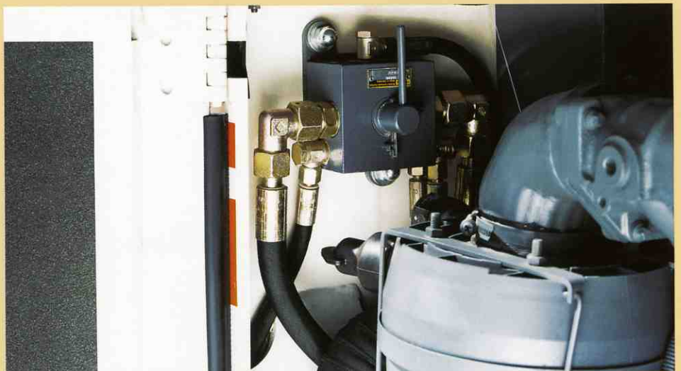
緊急時牽引装置（トーイング・デバイス）によってモーターが停止し、またはディーゼルタンクが空になった時マシンを移動することが出来ます。

稀なことではありますが、W350が「立ち往生」してしまった場合に2つの装置によって現場から機械を移動する事が出来ます。パーキング・ブレーキは駐車した時油圧によって作動していますが、牽引装置（トーイング・デバイス）で解除する事が出来ます。この機械のブレーキはステアリングホイールを右に一杯に回すと簡単に解除され、マシンは危険な場所から異動する事が出来るのです。