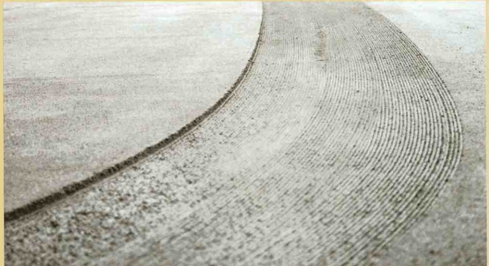
正確な作業:右は0cm、左は2.5cmの深さで楔形に切削。