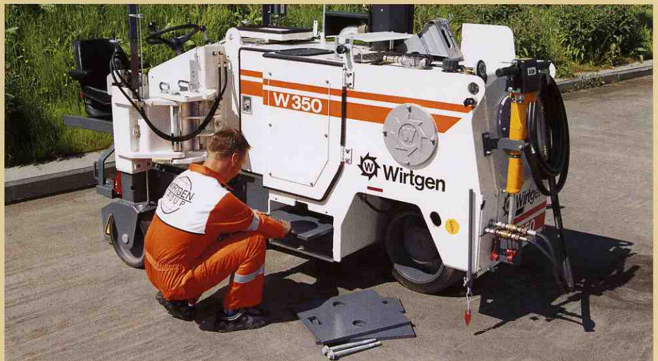
ビル内での作業のために作業重量を1.35トン減らすことができます。バラストは一人で簡単に取り外し可能です。