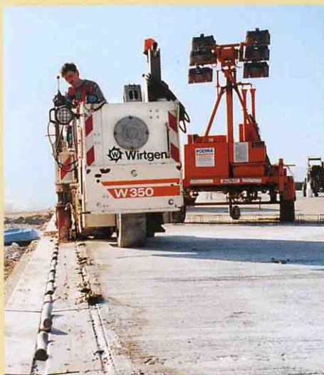
コンクリート舗装をしながら膨張目地の切削。