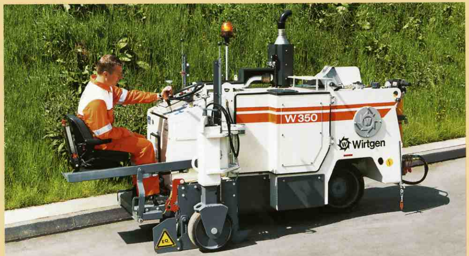
運転席のお陰で負担のかかる作業も快適に出来ます。—もちろん、しっかりと固定され、調整できます。

言うまでもないことですが、運転席を取り付ける際、運転席のサスペンションが機械的にフロアプレートに結合され、マシンの安全スイッチが作動するようになっています。