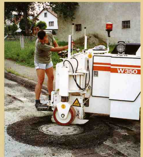
マンホールのまわりも数分できれいに。