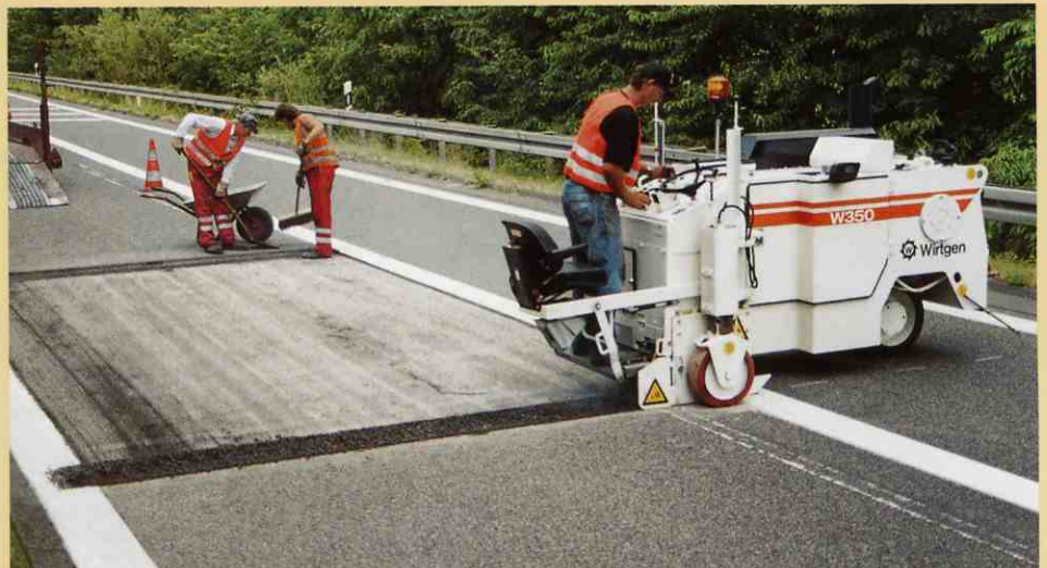
車線の端から横に切削することで正面にも直角なエッジが出来上がります。

W350の重心は低く、質量が良い具合に分散されており、切削機に取り付けるビットが最適に配置されているので、切削深さがかなりあっても、スムーズに動きます。また、騒音防止にも優れており、さらに使いやすいとなっております。このような作業で時折使われる付属の切削装置とちがって、W350の切削方法は現場の作業員に賞賛されています。