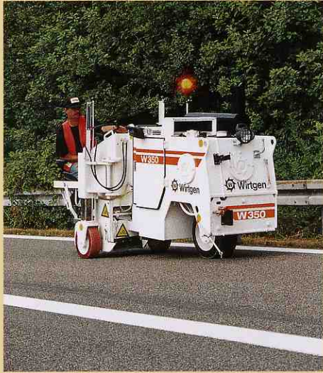
作業量が多くても疲れません。