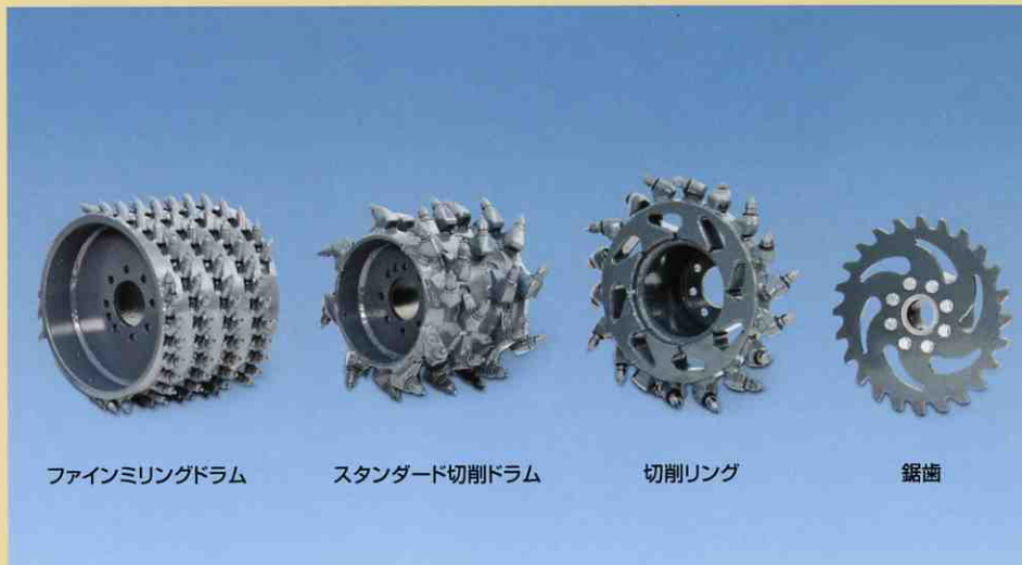
W350のさまざまな切削ドラムのサンプル:全ての切削ドラムと鋸歯はW350に最適です。