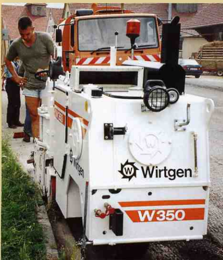
右後輪を中に折り畳むと、エッジにぴったり沿って舗装面を切削する事が出来ます。