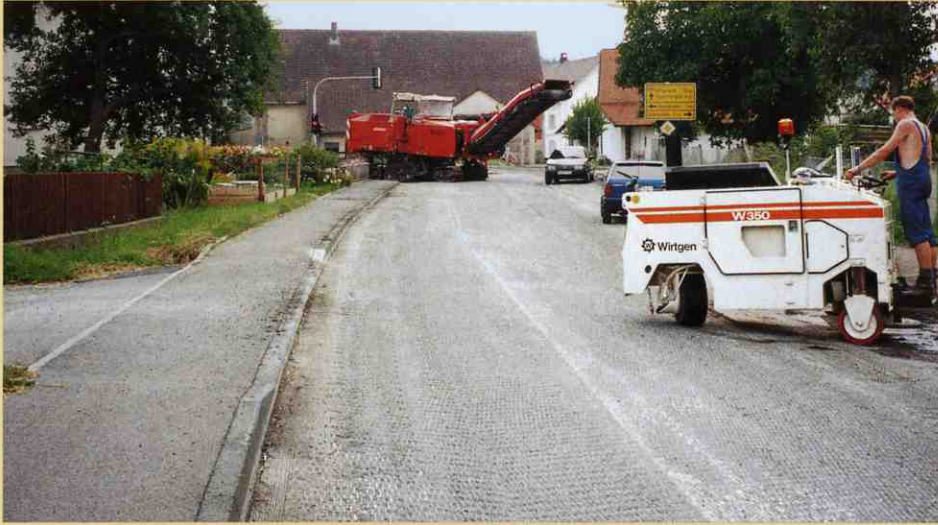
作業の分担:町を通る主要道路を切削している間、大型機が出来ない部分を除去するために待機中のW350。

単位面積あたりの能力が高いことが特徴の大きく、重い切削機は車道全体を補修する際に使用されます。