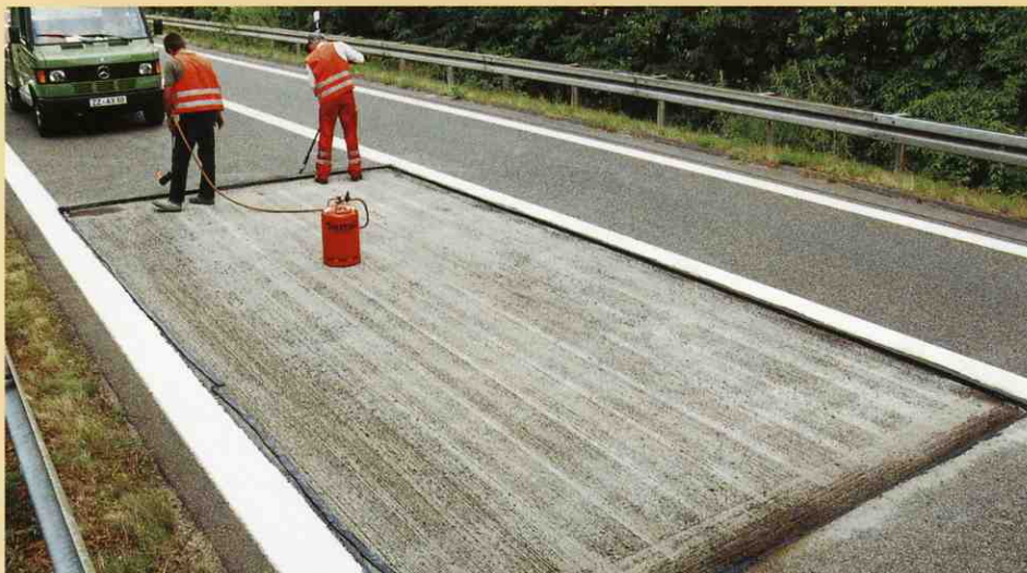
アスファルトシーラ材を切削したエッジ部分に入念に塗り密着します。

切削深さは正確に設定できるので、均一の厚さで新しい舗装が出来ます。 そのため新しい材料を節約できるだけでなく、新しい道路の転圧も均一に出来るのです。 切削した表面性状が良いため、新しい舗装材がよくかみ合います。 その結果、車が加速減速するときやカーブを曲がる際に発生する剪断応力が確実に下層に伝わります。 また道路表面全体の耐久力も確実に伸びます。