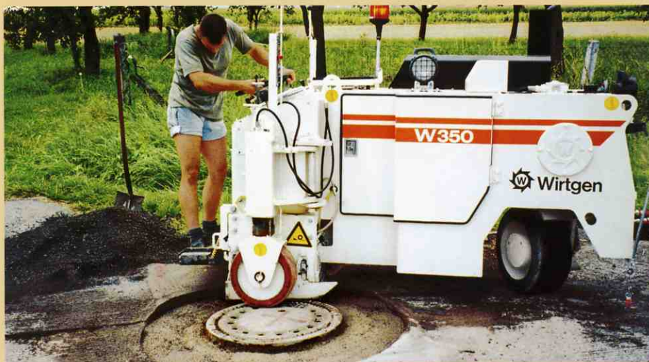
経費の高い手作業よりもきれいにマンホールの周りを切削。

広場、道路や舗道における切削工事において、小型切削機を使う場合、4cm以上の深さまで切削しなければならないことは珍しくありません。このような状況においてW350は苦もなく作業をこなします。W350は最大深さ10cmまでアスファルト層を取り除く事ができます。W350は標準の切削幅が35cmのため幅1mの道路を切削するときには道路と平行に3回に分けて切削作業を行えば、十分に余裕を持って切削できます。そのためW350は小型フィニッシャーやローラーを擁する「修理チーム」の理想的なパートナーとなるのです。