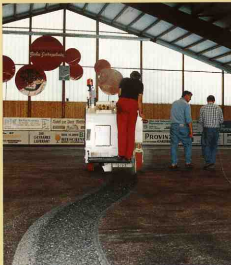
床に書かれた線を正確にたどっているW350。