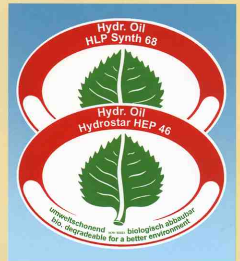
バイオ分解油圧オイルのお陰でW350は環境にやさしく作業できます。

それはこの機械がさまざまな粘性のある生物学的に分解する油圧オイルを使用して稼動しているからです。