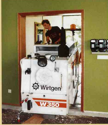
W350であれば狭いドアでも簡単に通り抜け出来ます。

切削深さは左右のコラムに付いている調節 ストッパーのお陰で正確に再現する事が出来 るため、均一に仕上げることが出来ます。 このことは高価な新材を1kgも無駄にせず に使用するために重要なことです。 一部分だけ補修が必要な場合には、床全体 を補修する必要はありません。 屋内の床の損傷した部分を切削し、新しく 舗装すれば十分なのです。