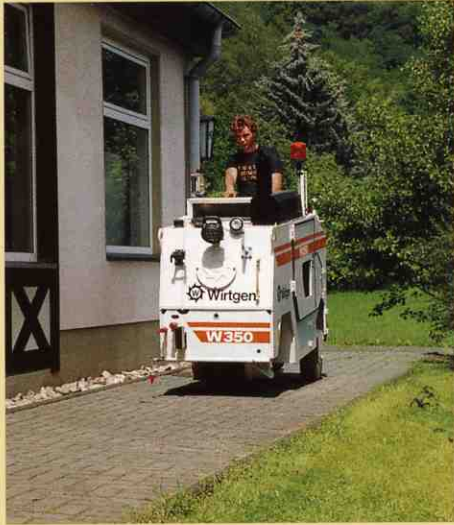
狭く、接地圧に対する容量が小さな舗道を走行中。