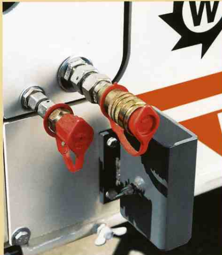
油圧ハンマーへの接続が容易に出来ます。

又、別の車に積込む必要がないので、忘れてたり、置き去りにしたりすることはありません。