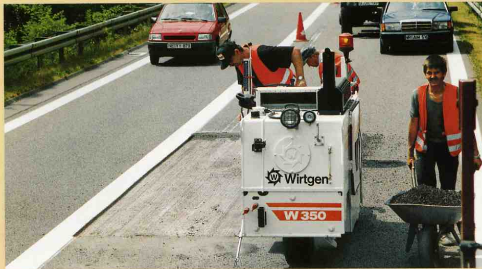
この現場では隣接レーンを開放して切削作業を実施し、切削廃材は手取り除いています。(26m 2 の切削作業に表面清掃も含めておおよそ1.5時間)。

このため、最終的なオーバーレイを施工する前に、一時的に充填補修された溝、例えばそれが道路の端にあっても一緒に切削して除去するのに最適な機械です。W350は舗装作業へつなぐ働きをしています。楔形の場所はそんなに大きくありませんが、きれいに取り除かなければなりません。このような場合にこそ輸送が容易で、しかも経験のないオペレーターでも難なく操作できるこの機械は理想的な機械であると言えます。