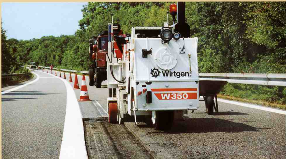
幅1mの道路表層を3回に分けて切削中。