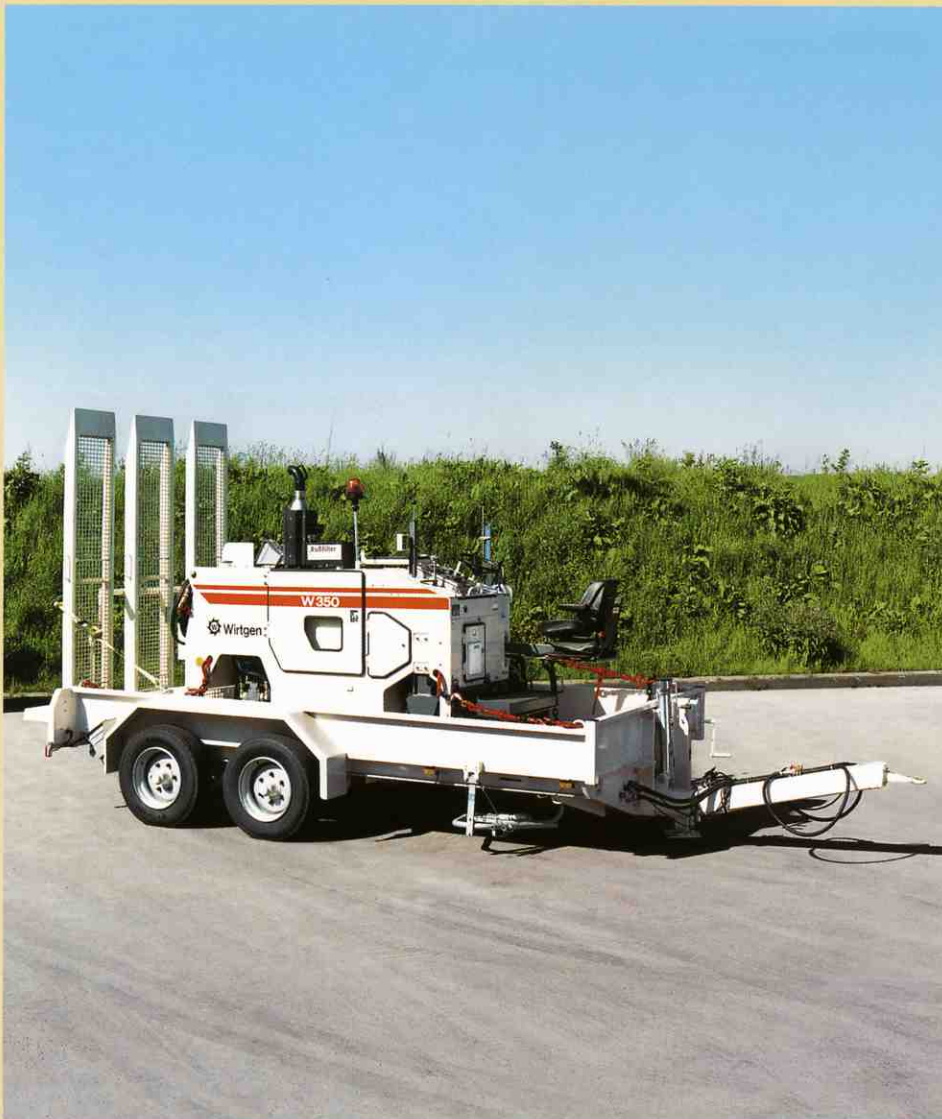
一人でも積込めるように設計された輸送トレーラーT89は大きさ及び許容積載量ともW350を輸送するためにデザインされました。

多くの場合、生物学的に分解されなければならないオイルの規制があります。W350はこの点に関して全く問題ありません。